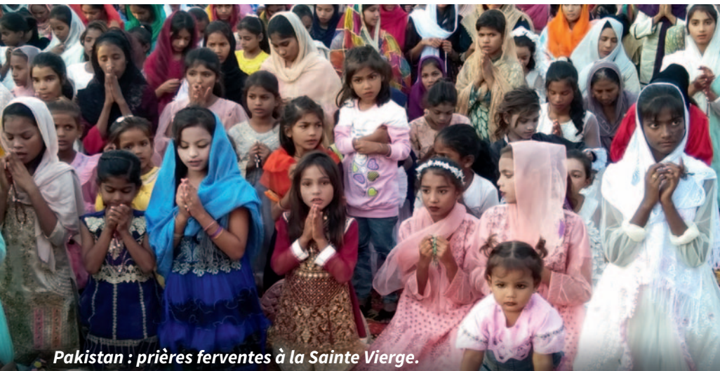
Pakistan : prières ferventes à la Sainte Vierge.

Dans les pays où règne la violence, les gens savent qu'ils n'ont pas beaucoup d'aide à attendre des politiciens, de l'armée et de la police. Les catholiques cherchent leur aide auprès du Seigneur et de la Sainte Vierge.