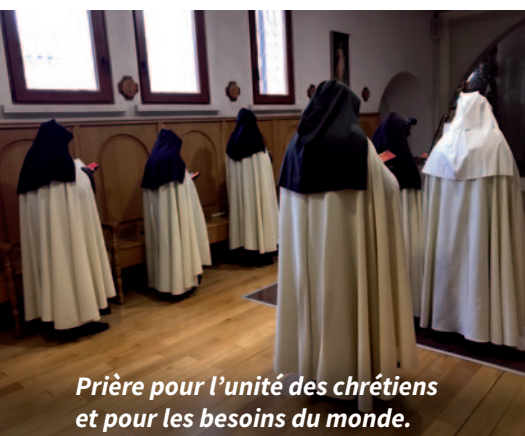
Prière pour l'unité des chrétiens et pour les besoins du monde.

C'est pourquoi nous soutenons à la fois les Carmélites et les Sœurs de l'Eucharistie par une aide annuelle à la subsistance de CHF 8'700 à chaque congrégation. En ce mois de Marie, voudriez-vous leur faire un cadeau ?