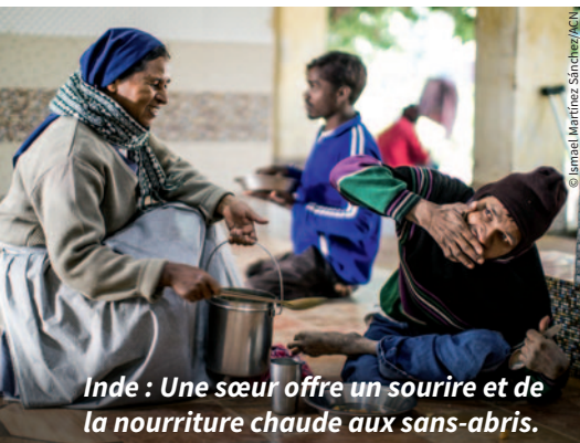
Inde : Une sœur offre un sourire et de la nourriture chaude aux sans-abris.

Avocate et secours dans tous les besoins, médiatrice des grâces, consolatrice des affligés, ce sont quelques-uns des titres de Marie. De même qu'aux noces de Cana la Sainte Vierge a indiqué à son Fils ce dont manquaient les époux, elle lui confie également aujourd'hui nos détresses. Près de 600'000 religieuses dans le monde font comme Marie, en repérant les détresses avec un cœur maternel et en essayant d'y remédier.