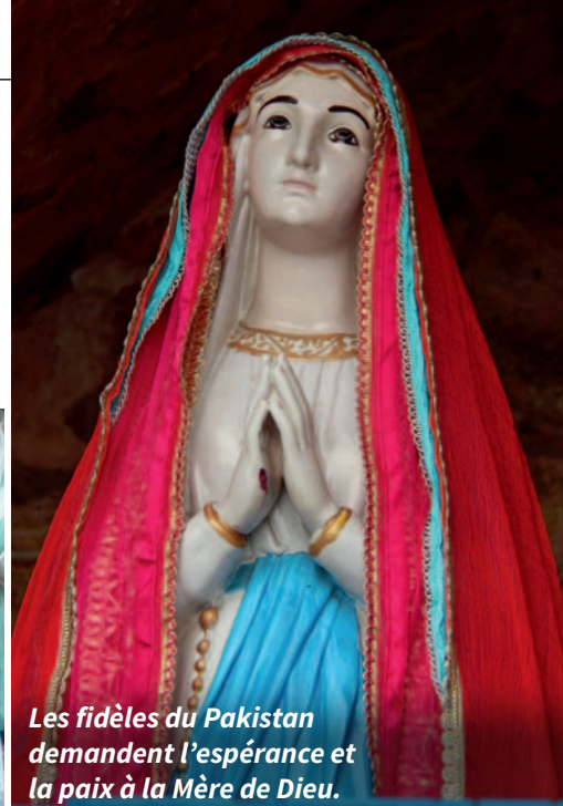
Les fidèles du Pakistan demandent l'espérance et la paix à la Mère de Dieu.