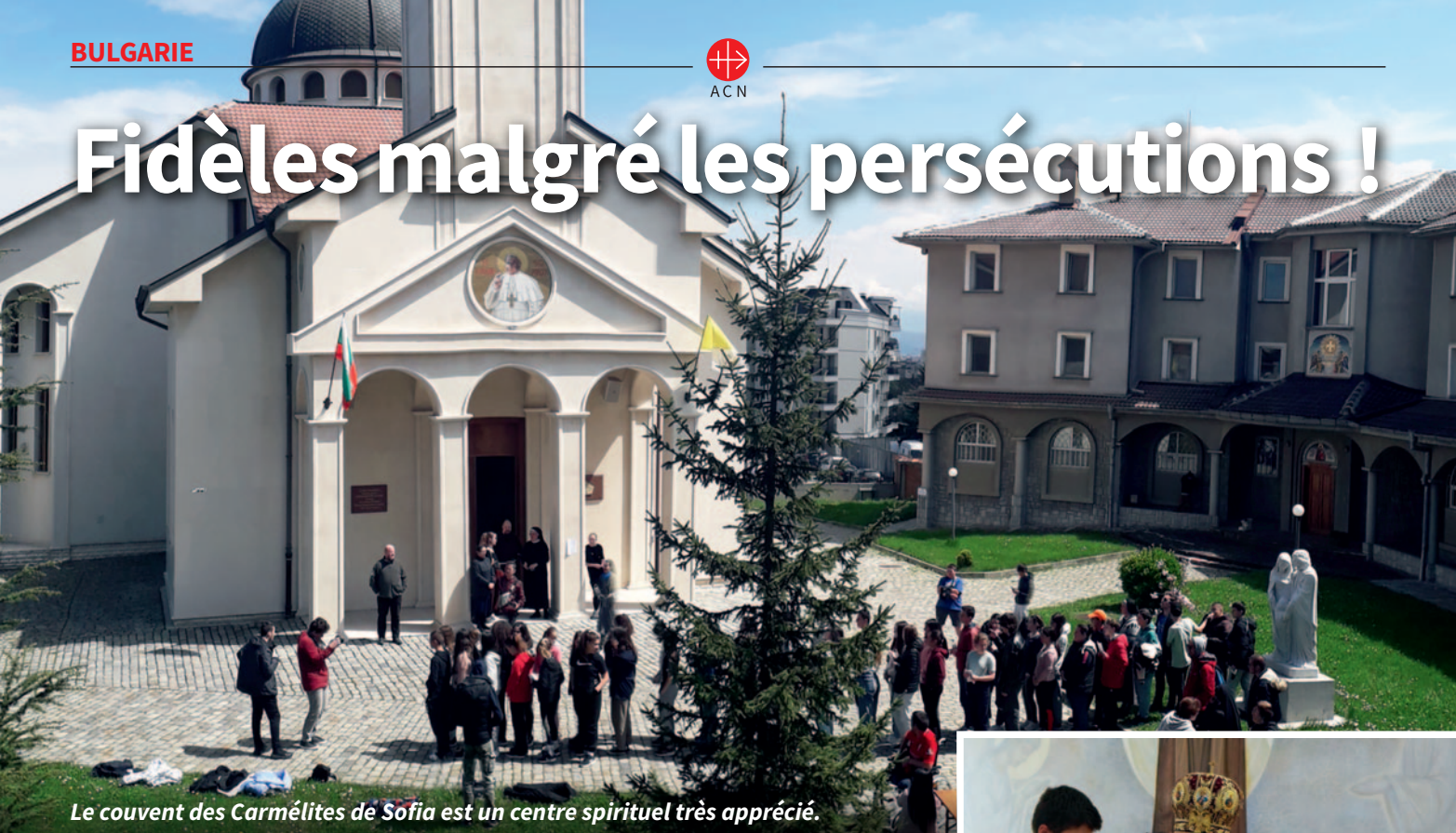
Le couvent des Carmélites de Sofia est un centre spirituel très apprécié.

La Bulgarie est l'un des pays où les fidèles ont été durement persécutés à l'époque communiste. Certaines personnes rapportent que la Vierge les a aidés d'une manière spéciale.