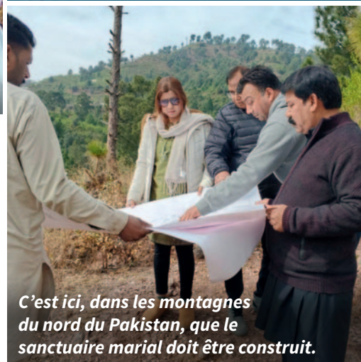
C'est ici, dans les montagnes du nord du Pakistan, que le sanctuaire marial doit être construit.