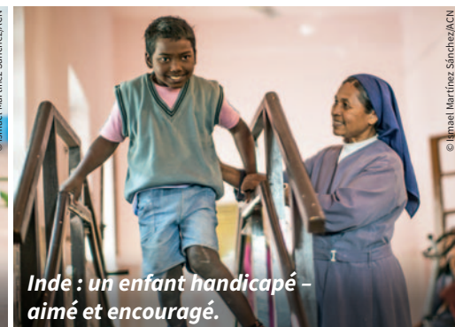
Inde : un enfant handicapé - aimé et encouragé.