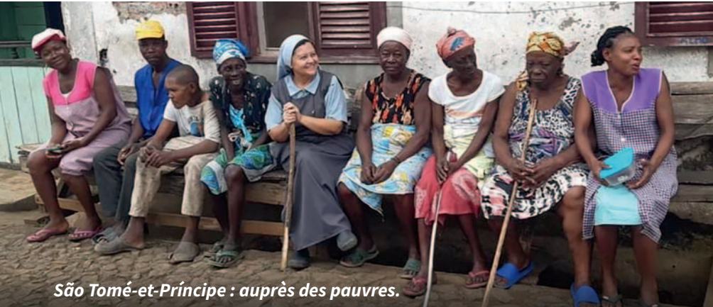
São Tomé-et-Príncipe : auprès des pauvres.

Avocate et secours dans tous les besoins, médiatrice des grâces, consolatrice des affligés, ce sont quelques-uns des titres de Marie. De même qu'aux noces de Cana la Sainte Vierge a indiqué à son Fils ce dont manquaient les époux, elle lui confie également aujourd'hui nos détresses. Près de 600'000 religieuses dans le monde font comme Marie, en repérant les détresses avec un cœur maternel et en essayant d'y remédier.