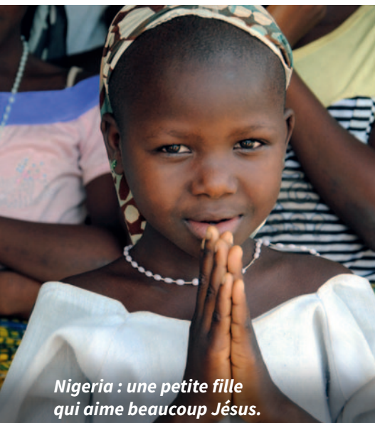
Nigeria : une petite fille qui aime beaucoup Jésus.

Dans la ville d'Amuzi, dans le sud-est du Nigeria , l'église paroissiale est également consacrée à Marie. Une chapelle doit y être construite afin de permettre l'adoration eucharistique de jour comme de nuit. Dans la paroisse, il y a déjà un groupe qui