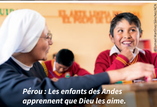
Pérou : Les enfants des Andes apprennent que Dieu les aime.