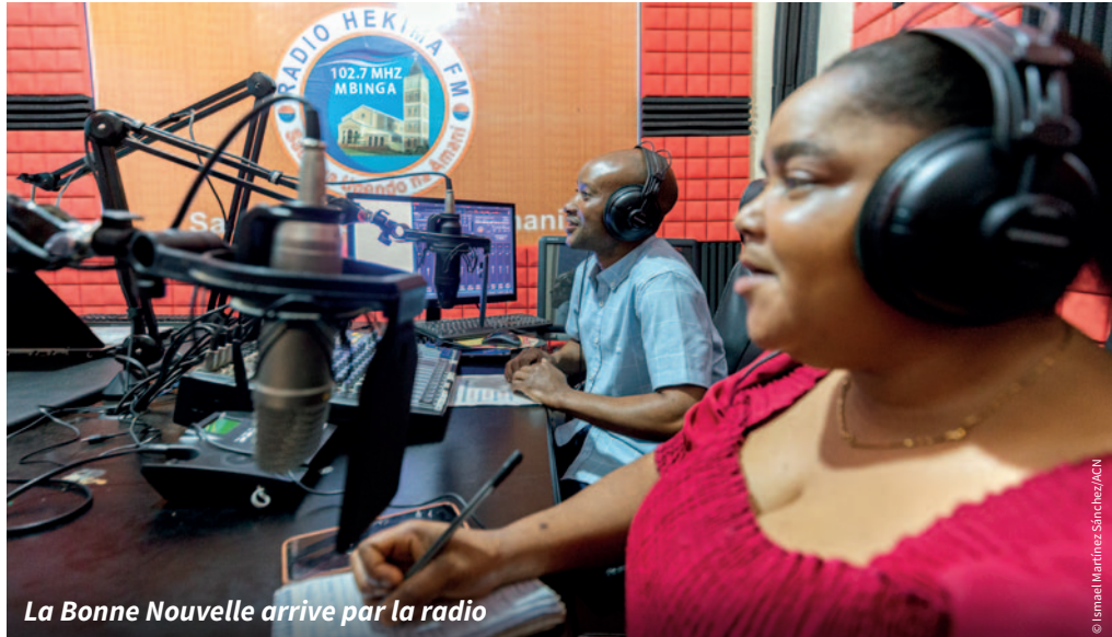
La Bonne Nouvelle arrive par la radio

C'est surtout pendant la pandémie que de nombreuses personnes ont, d'une certaine manière, vu l'Église entrer chez elles par la télévision, la radio ou Internet. Mais même en temps « normal », il est déjà arrivé à bon nombre d'entre nous d'écouter une émission un jour de pluie, une nuit d'insomnie ou tout en étant alité pour raison de santé, et d'en retirer soudainement du réconfort, des réponses et de précieux élans de foi. Même des personnes qui, sans cela, n'auraient jamais aucun contact avec l'Église, entrent en relation avec Dieu de cette manière, comme « par hasard ». On entend fréquemment des déclarations telles que : « J'étais déprimé et désespéré, et j'ai vu par hasard cette vidéo sur Internet » ou « À vrai dire, j'avais envie de ne