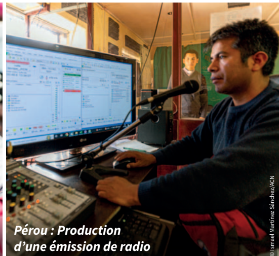
Pérou : Production d'une émission de radio

rien faire, je passais d'un programme à l'autre et, soudain, j'ai entendu ce prêtre parler de Jésus-Christ. Je n'avais encore jamais rien entendu de tel. »