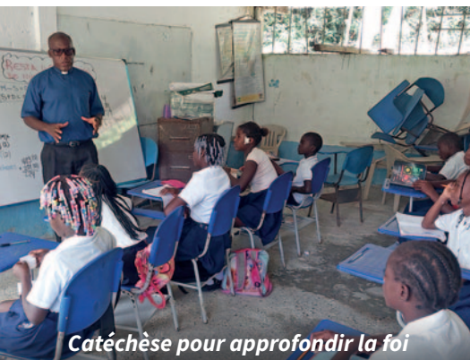
Catéchèse pour approfondir la foi

Mais nous voudrions également contribuer à ce que les paroisses – surtout dans les régions difficiles – ne restent pas aussi longtemps sans prêtre. Car l'exemple de Noanamito montre l'importance des prêtres. C'est pourquoi nous soutenons régulièrement la formation sacerdotale dans plusieurs séminaires de Colombie, afin que les fidèles ne se sentent pas « oubliés par l'Église ».