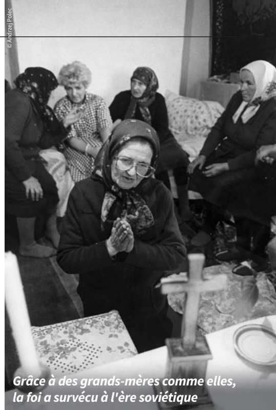
Grâce à des grands-mères comme elles, la foi a survécu à l'ère soviétique

Ce sont aussi les grands-mères qui, par temps de persécution, priaient en secret dans les cimetières avec d'autres fidèles, baptisaient les enfants et préparaient le jour où un prêtre reviendrait enfin célébrer la messe.