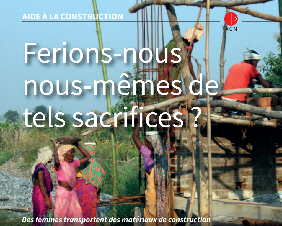
Des femmes transportent des matériaux de construction