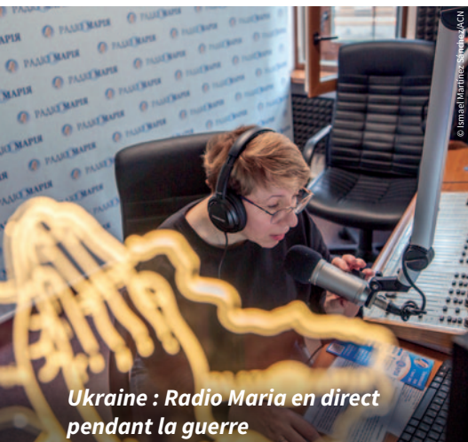
Ukraine : Radio Maria en direct pendant la guerre

Grâce à votre aide, la Bonne Nouvelle atteint d'innombrables personnes dans le monde entier, que ce soit chez elles, à l'hôpital, dans une prison ou une région reculée. Dieu peut ainsi toucher leur cœur – souvent de manière inattendue. Voudriez-vous continuer à soutenir cet apostolat ?