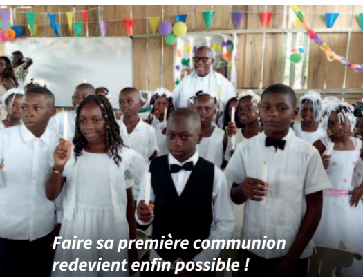
Faire sa première communion redevient enfin possible !