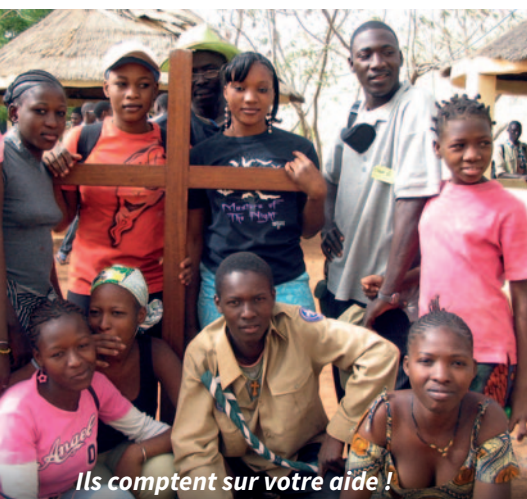
Ils comptent sur votre aide !

De vastes régions du Mali sont sous le contrôle des djihadistes. De nombreuses familles chrétiennes fuient la terreur vers la capitale Bamako, d'où l'apparition de nouveaux bidonvilles.