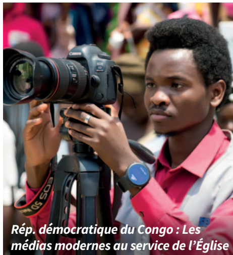
Rép. démocratique du Congo : Les médias modernes au service de l'Église