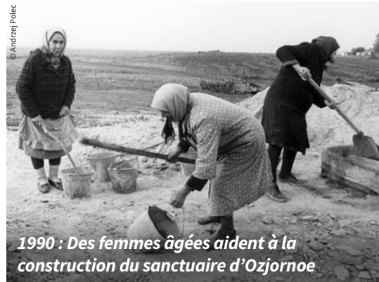
1990 : Des femmes âgées aident à la construction du sanctuaire d'Ozjornoe

Beaucoup d'entre elles ont dû attendre des décennies. Sans leur témoignage silencieux mais courageux et fidèle, la flamme de la foi se serait éteinte dans cette sombre époque. C'est à elles que nous souhaitons rendre hommage ici.