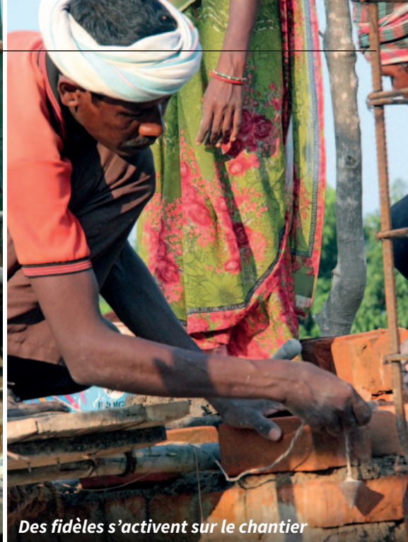
Des fidèles s'activent sur le chantier