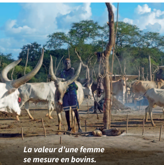
La valeur d'une femme se mesure en bovins.

Les facteurs culturels jouent également un rôle. Le groupe ethnique le plus important au Soudan du Sud est celui des Dinkas, un peuple d'éleveurs principalement nomade qui pratique la polygamie.