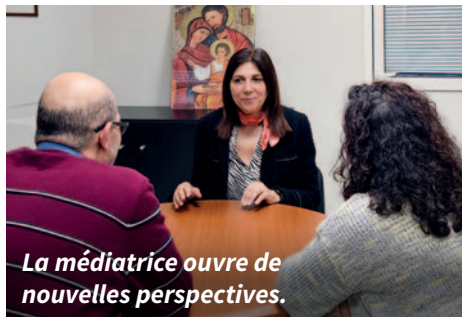
La médiatrice ouvre de nouvelles perspectives.