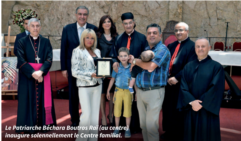
Le Patriarche Béchara Boutros Raï (au centre) inaugure solennellement le Centre familial.

Un garçon de sept ans, dont les parents séparés étaient irrémédiablement brouillés, a également été aidé. Son père, avec qui il vivait, l'avait tellement remonté contre sa mère qu'il criait et pleurait dès qu'il la voyait. Au cours de discussions avec les deux parents, les conseillers du centre familial ont pu faire comprendre au père qu'il infligeait à son enfant de graves blessures psychologiques qui resteraient perceptibles jusque dans sa vie d'adulte. Le père s'est rendu compte de ses torts et a encouragé son fils à rester en contact