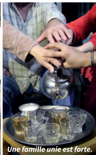
Une famille unie est forte.