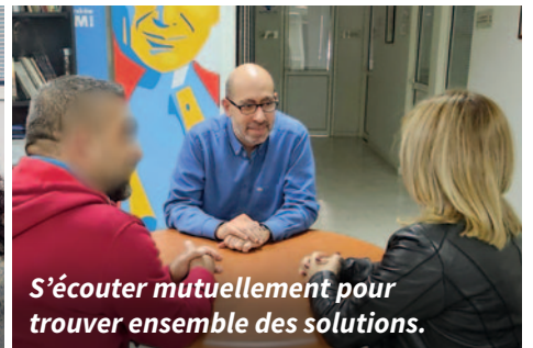
S'écouter mutuellement pour trouver ensemble des solutions.

avec sa mère et à l'aimer. La mère en pleurait de joie en serrant son enfant contre son cœur, tandis que ce dernier lui répétait : « Maman, je t'aime beaucoup. »